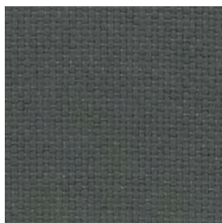
8007 - Anthrazit