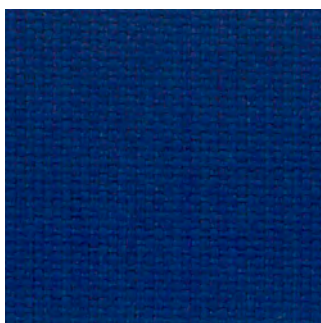
6080 - Blau