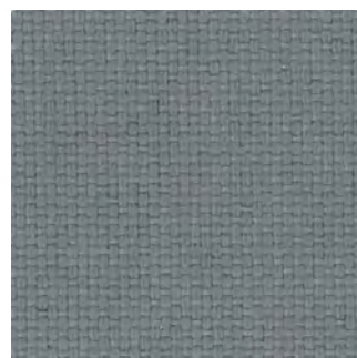
8014 - Mittelgrau