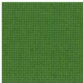
7019 - Grün