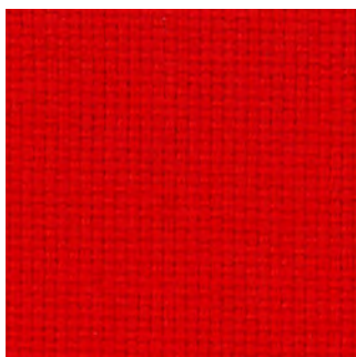
4027 - Rot

Brandschutz: B1 (DIN 4102), EN 1021-1/2, C1 (UNI 9114-UNI 8456), M1 (NF P 92501-7), BS 7176 Medium Hazard