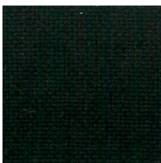
8033 - Schwarz