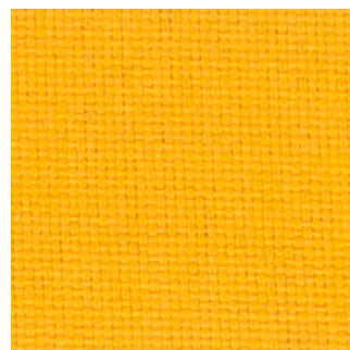
3090 - Gelb