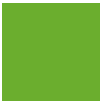
Gelbgrün RAL 6018