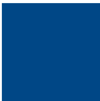
Signalblau RAL 5005