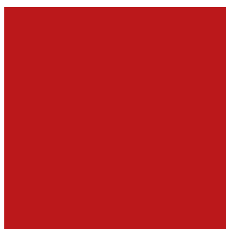
Rubinrot RAL 3003