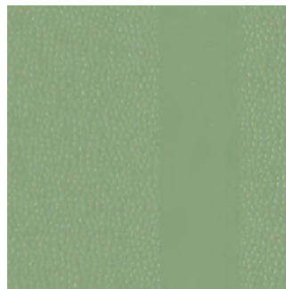
Blassgrün (ähnl. RAL 6021)