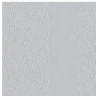
Lichtgrau (ähnlich RAL 7035)