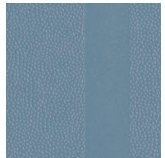
Pastellblau (ähnlich RAL 5024)