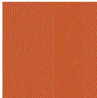
Rotorange (ähnlich RAL 2001)