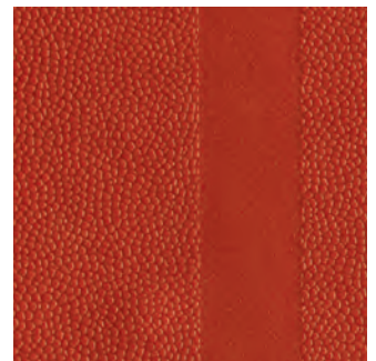
Rot (ähnlich RAL 3013)