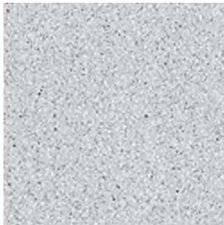
Terrano grau 0166

Rohspanplatte erhöht feuchtigkeitsbeständig mit 2 x 1mm HPL-Belag und umlaufender 5mm Vollkunststoffkante.