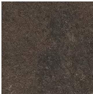
Ceramic Anthrazit 0473