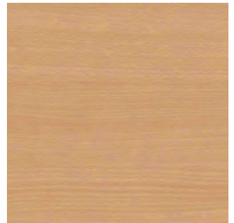
Buche natur 0352