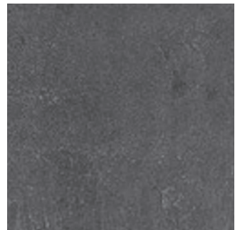
Beton dunkel 0298